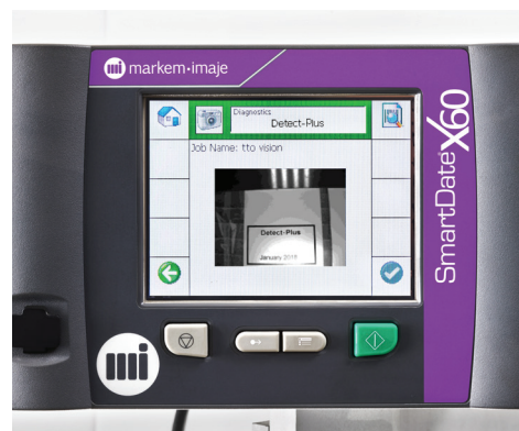
Kontrola kódů v reálném čase přímo na uživatelském rozhraní