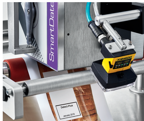
Kompaktní rozměry pro bezproblémovou instalaci