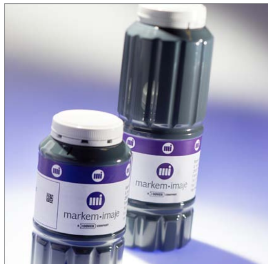
39.000 označených krabic pouze z 1L inkoustu

* Při standardním používání 16 znaků, 7N-13 mm velikosti bodu 3