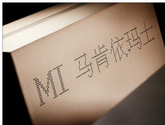
Více znaků a log v několika jazycích.